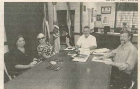
EDTC / PREF. BUTIÁ

de oferecerá serviços como assessorias e consultorias para as secretarias de Desenvolvimento ou órgão que o equivalha, para elaboração e modernização de políticas de apoio a inovação, incluindo programas de apoio nas empresas para o desenvolvimento dos municípios; oficinas de sensibilização e capacitação quanto ao empreendedorismo; elaboração e execução de programas de capacitação nas mais diversas áreas; pesquisas de diagnósticos empresariais e potenciais regionais; implantação de uma incubadora tecnológica em General Câmara para fomentar o empreendedorismo, geração e emprego e renda regional; consultorias nas mais di-